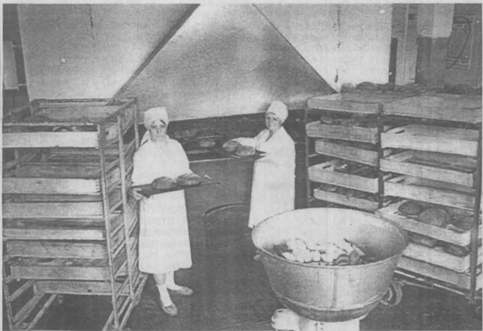
На снимке: продукция Ленинск-Кузнецкого хлебокомбината готовится к отправке в торговую сеть.

Председатель городского Совета народных депутатов.