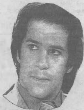
(Первый канал, 19 часов).

КОВАРСТВО, ЛЮБОВЬ, ОБМАН В ФИЛЬМЕ "КЛОН"