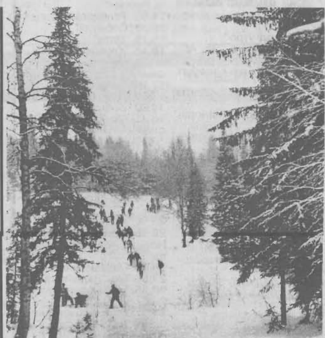
Мороз и солнце.