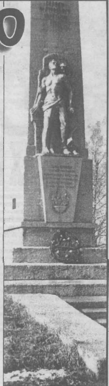
встало на сторону мятежников...

Из бесед и разговоров мне удалось узнать, что ранним утром 6 апреля по тревожным гудкам рудничных шахт к штабу стали стекаться рабочие и женщины, где образовался митинг. Толпа была громадная. На митинге предложили создать Красную гвардию и произвести запись с раздачей захваченного оружия. Позже был выбран Совдеп со всеми отделами: военно-революционный комитет, агитационный отдел, следственная комиссия. Очевидно, что восстание и захват рудника явились результатом организационной работы, которая велась подпольно. При этом большинство солдат сразу же