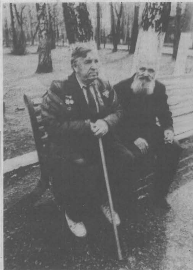
Повеяло весной.