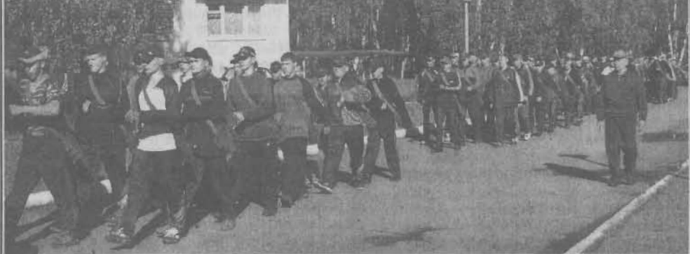
На снимке: выход на очередную дистанцию.

Специалист управления образования по спортивно-массовой и физической культуре работе.