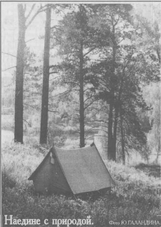
Наедине с природой.

11 сентября, в воскресенье, в каминном зале библиотеки имени Н.К. Крупской состоится занятие литературной группы "Парус". Приглашаются все желающие.