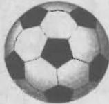
Турнирная таблица Первенства России по футболу. Второй дивизион. Зона «Восток» (по состоянию на 1 июня)