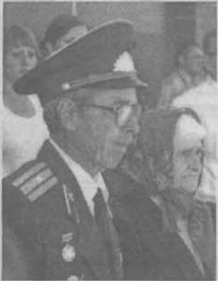
На территории ПЧ-1 по улице Ленина, 36а открылся уникальный музей, экспонаты которого рассказывают об истории пожарной охраны.

Раньше в этом стареньком бревенчатом здании 1926 года постройки располагалось пожарное депо. После ремонта и реконструкции ему нашли другое применение, создав здесь филиал общественного музея Главного управления МЧС России по Кемеровской области. Его торжественное открытие стало для города ярким и запоминающимся событием.