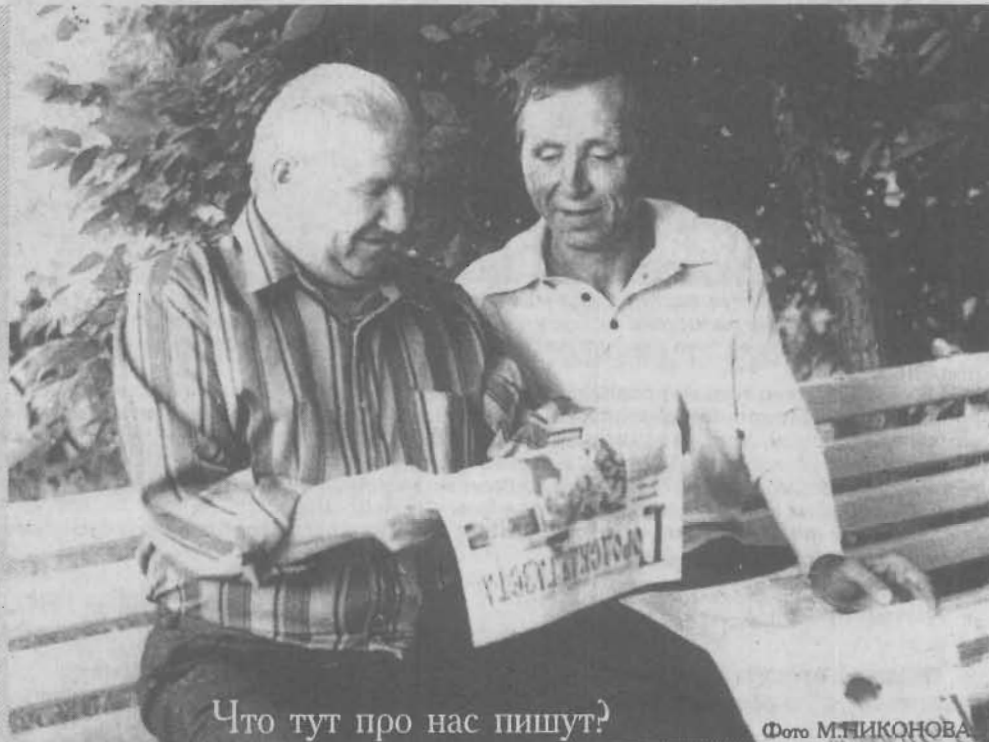
Что тут про нас пишут?

Принарядившиеся робкие осины В сторонке держатся несмелою гурьбой, А перед ними, подбоченившись красиво, Подросток-клен любит себя собой