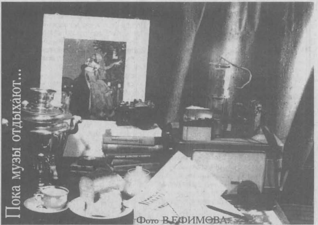
Пока музы отдыхают...