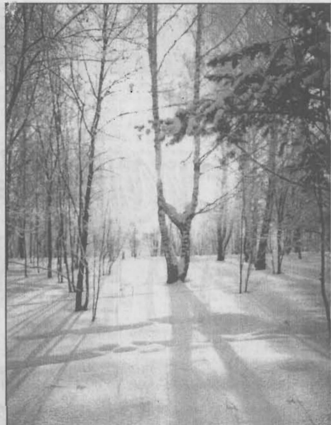
Сказка зимнего леса.