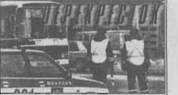
служающего соответствующую территорию.

О принятом решении должностное лицо информирует заявителя, но не позднее 30 дней с момента поступления заявления.