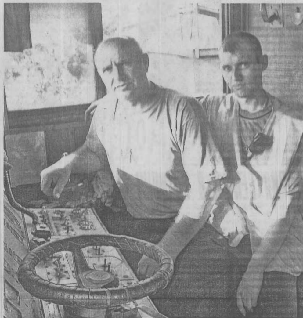
Коллектив станции «Ленинскуголь» с начала года отправил более 31 тысячи вагонов, в которых перевезено 2154 тысячи тонн различных грузов.