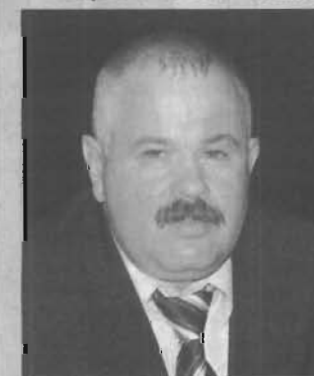
Примите самые искренние и теплые пожелания в связи

с профессиональным праздником – Днем шахтера!