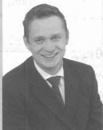
Сегодня уже кажется невероятным, что всего 10 лет назад

всерьез стоял вопрос – быть или не быть российскому угледобывающему, сможет ли он выбраться из глубокого системного кризиса. Российская угольная отрасль смогла не только выстоять и сохранить свою мощь, потенциал, кадровый резерв, но и возродиться в качестве прочной опоры отечественной экономики, залога энергетической безопасности страны и ее дальнейшего динамичного развития.