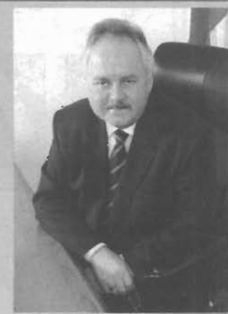
России на мировом угольном рынке.

Значительная заслуга трудового коллектива ОАО «СУЭК-Кузбасс» также в том, что он не только сохранил лучшие традиции горняцкого дела, но и сумел поднять на новый уровень технологию добычи угля, усилить позиции