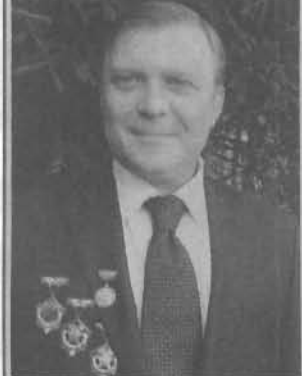
Уважаемые горняки компании «СУЭК»!

Сегодня наш праздник! От всей души поздравляю вас! Желаю здоровья, счастья, семейного благополучия. Роста во всех производственных показателях за исключением травматизма и зольности добываемого угля.