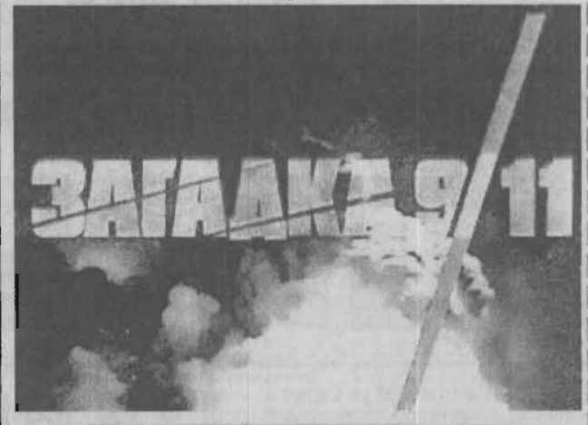
Д/ф «Загадка 9/11» Смотрите на канале OPT 12 сентября

Авторы этого документального фильма поставили перед собой задачу доказать, что башни-близнецы Всемирного торгового центра обрушились 11 сентября 2001 года не из-за пожара, возникшего после того, как в здания врезались самолеты, захваченные террористами, а в результате управляемых взрывов.