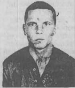
Лица, располагающих какой-либо информацией, просим сообщить по телефонам: 8 (384-56) 3-43-66, 3-43-03, 5-37-76, 3-01-81 или 02.