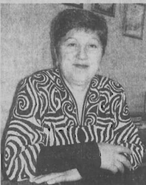
сомневаюсь, она скоро так же прославит и город, и Кузбасс, и Россию.

Подытожив только самое главное, скажу: год машет спортсменам и их семьям счастливой рукой, желая новых успехов и рождения новой талантливой смены. Не