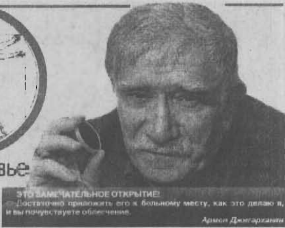
ЭТО ЗАМЕЧАТЕЛЬНОЕ ОТКРЫТИЕ! Достаточно приложить его к больному месту, как это делаю я, и вы почувствуете облегчение. Акимов Джигарханли

Выставка-продажа «Биоактиватора», а также подробная консультация по его применению будут проходить в ДК им. Ярославского (пр.Кирова, 106) 23 января с 13 до 14 часов