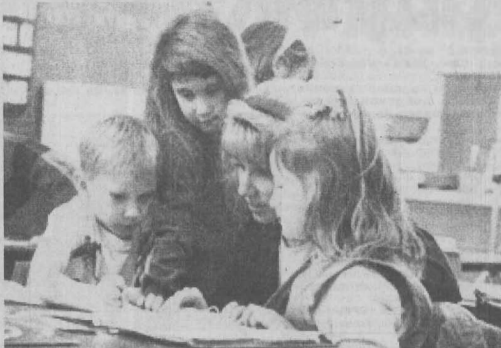
Приложение к Положению об организации деятельности семейных групп, являющихся структурными подразделениями муниципальных дошкольных образовательных учреждений