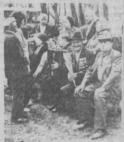
рублей. В Кемеровской области почти 300 тысяч человек имеют право на ЕДВ.

Установлены также новые размеры ежемесячных денежных выплат федеральным льготникам. Увеличение составит для инвалидов от 60 до 130 рублей, для участников Великой Отечественной войны – от 120 до 200