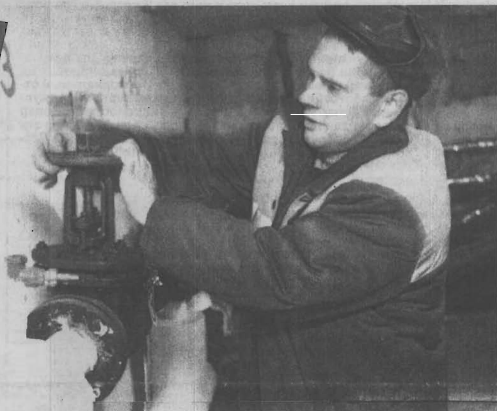
Подготовка к зиме