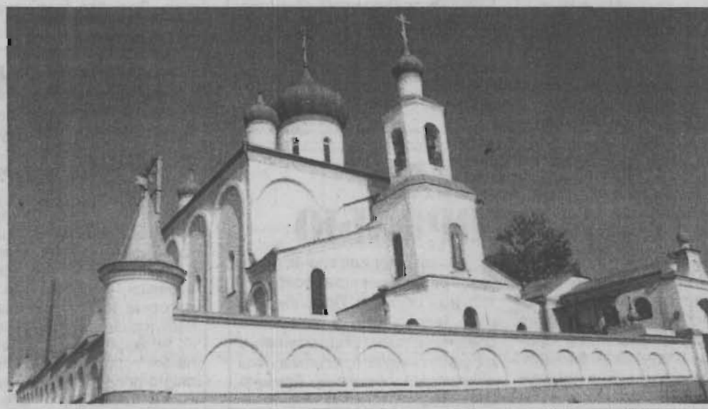
Страница подготовлена при участии пресс-центра храма Новомучеников и Исповедников Российских.

На снимках: Свято-Серафимо-Покровский монастырь; молебен у Поклонного креста на месте некогда разрушенной Покровской церкви.