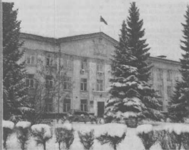
Пятого декабря нынешнего года сотрудники Ленинск-Кузнецкого городского суда отмечают пятидесятилетие со времени образования своего учреждения, и это стало поводом перелистать страницы истории.

Суд города Ленинска-Кузнецкого образован в декабре 1960 года в соответствии со статьей 27 Закона о судостроительстве РСФСР, принятого на третьей сессии Верховного Совета РСФСР. Это не значит, что до того времени судебные дела в Ленинске-Кузнецком не рассматривались. Просто раньше у нас действовали пять участков народных судов. Они и вошли в состав вновь созданного городского суда. Теперь в архиве хранятся дела, рассмотренные в предшествующие этому событию время. Например, три уголовных дела 1937 года, десять дел 1938 года. В эти же годы рассмотрено соответственно 130 и 102 гражданских дела и так далее. В 1949 году судьи рассмотрели уже 510 уголовных и 300 гражданских дел.