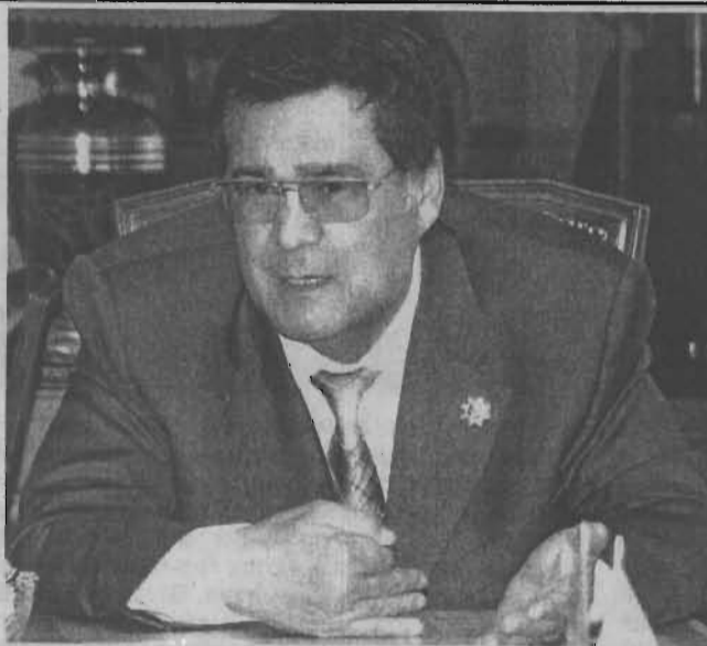
шахтеров и металлургов.

Среди приоритетов в социальной сфере А.Г.Тулеев отметил поддержку ветеранов, учителей, врачей,