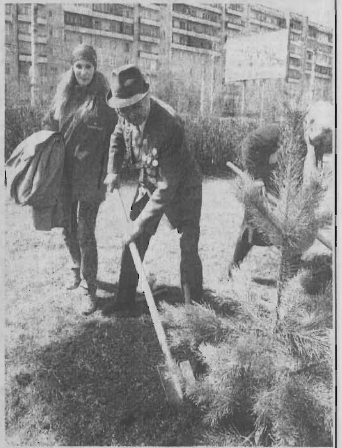
На снимках: памятный знак в сквере имени З.Тусноловой установлен; и ветераны и молодые посадили в этом месте юные сосенки.