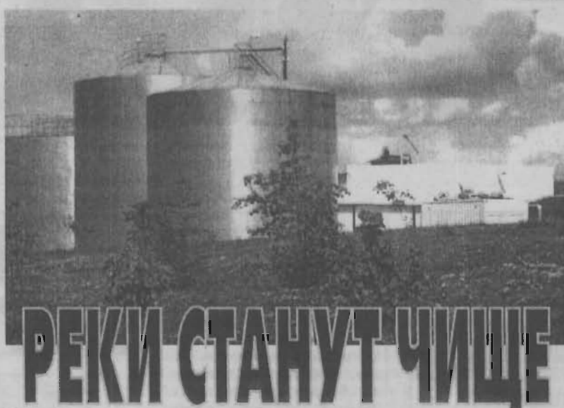
РЕКИ СТАНУТ ЧИЩЕ

Общая стоимость проекта составляет 160 миллионов рублей. Сейчас вся проектная документация проходит проверку в Главгосэк-