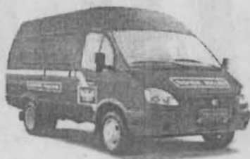
В интересах клиентов

На фоне значительного снижения в последние десятилетия объемов почтовых услуг на селе у Почты России, в том числе и нашего почтамта, ведь мы обслуживаем и Ленинск-Кузнецкий район, и отдаленные поселки Польшаева, растут расходы на содержание этой сети за счет