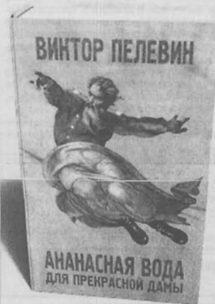
«Ананасная вода для прекрасной дамы : сборник повестей и рассказов / Виктор Пелевин. — М.: Эксмо, 2010.

В центральной городской библиотеке имени Н.К. Крупской появилась новая книга Виктора Пелевина, вышедшая в России небывалым сегодня столетидесяти тысячным тиражом. «Ананасная вода для прекрасной дамы» — так называется новый сборник повестей и рассказов Виктора Пелевина. Это сборник повестей в двух частях. Остановимся на сюжетах некоторых из них.