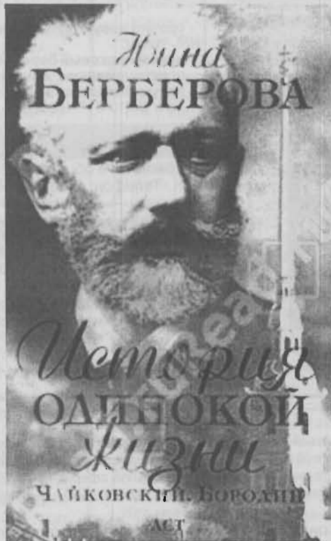
История одинокой жизни: Чайковский, Бородин / Нина Берберова. — М. : АСТ : Астрель, 2010.

В мире, который описывает Пелевин, нет «живой жизни»: ни животных, ни деревьев, ни детей, ни женщин. Ничего натурального. Встает, конечно, вопрос: каким образом человек, не знающий «живой жизни», не изучивший Божьего творения, может составить представление о его Создателе? Как можно рассуждать о художнике, не видя его картин, или толковать писателя, не прочтя ни одной его книги? А именно эта задача — рассуждать и толковать о Вселенной и ее Создателе, очевидно, будоражит постоянно мудствующего Пелевина. Для меня этот вопрос остался без ответа.