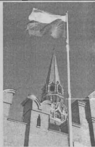
цвет, и никакой другой».

Но официальный статус флаг приобрел только в 1896 году, когда накануне коронации Николая II министерство юстиции определило, что национальным должен «окончательно считаться бело-сине-красный