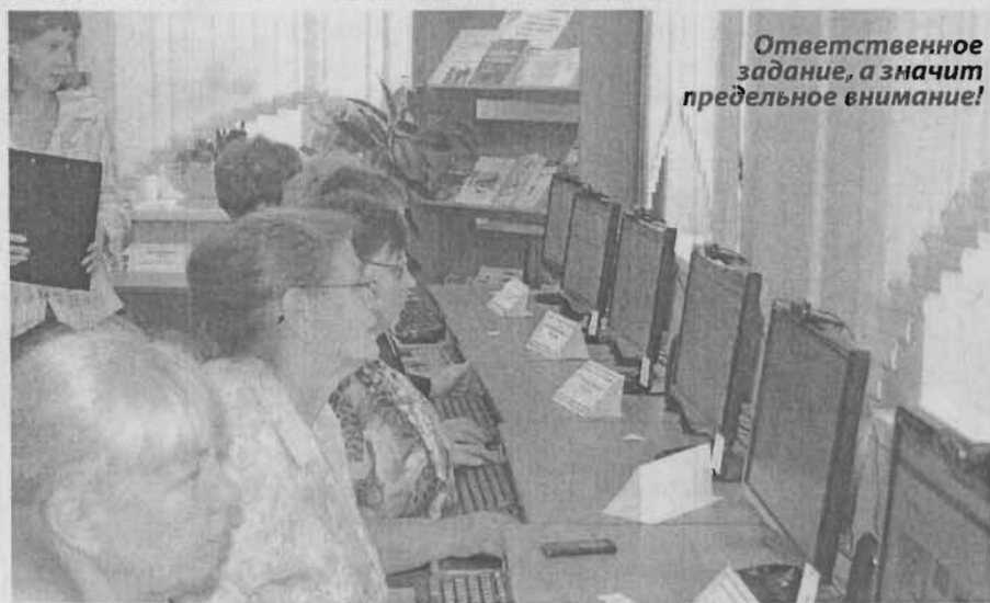
Ответственное задание, а значит предельное внимание!

Параллельно для зрителей, преимущественно пенсионеров, которые только начали обучаться по проекту «Твой курс», на экране с помощью слайдов демонстрировали работу с интернетом: как зайти на портал государственных услуг, записаться через интернет на очередь к врачу и многое другое. Проект «Твой курс» набирает обороты!