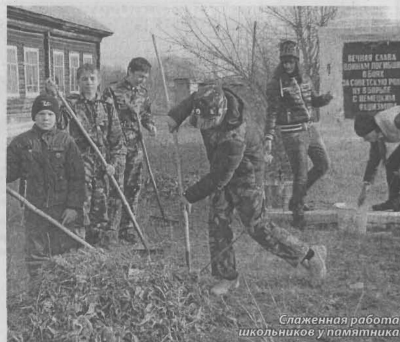
Слаженная работа школьников у памятника