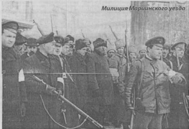
Милиция Мариинского уезда