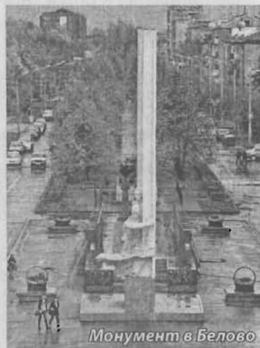
Монумент в Белове

В парке «Приморский» состоялось торжественное открытие лиловой аллеи и памятной плиты с именами комсомольцев, а в культурном центре Инской для беловчан воссоздали атмосферу советских лет и организовали театрализованное представление. При входе всем участникам крепились комсомольские значки, столы для регистрации задрапиро-