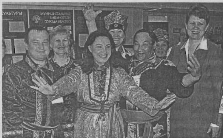
Надежде Бабкиной понравилось в «Чолкое»

Сегодня музей «Чолкой» серьезно работает по развитию туризма в Кемеровской области, активно развивается в российском и международном масштабах. Музей неоднократно принимал делегации США, Германии, Канады, Ирландии, Мексики, Кореи, Турции, Таиланда, Монголии, Польши, Китая. Ежегодно здесь бывают около 28 тыс. человек.