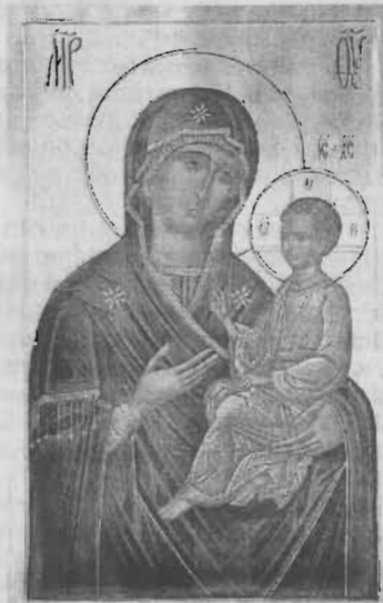
многие чудеса по вере и усердию людей!

Особенность этой иконы в том, что когда перед этой иконой собираются люди и читают акафист, она начинает благоухать! По благословению митрополита Викентия эта икона побывала во многих епархиях, и везде происходили многочисленные чудеса по вере и усердию людей!