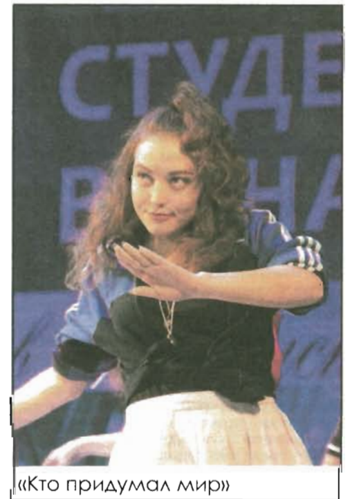
«Кто придумал мир»