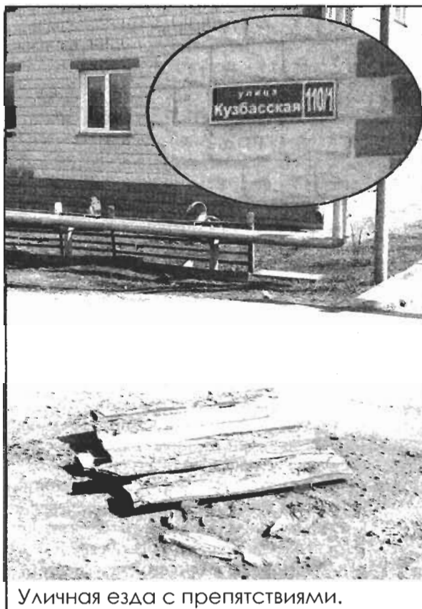
Уличная езда с препятствиями.