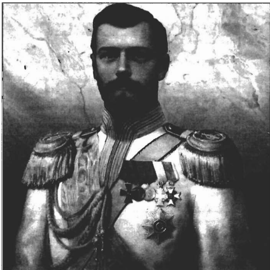
Николай Александрович Романов (1868 - 1918) - Император Всероссийский, Царь Польский и Великий Князь Финляндский. Военское звание - полковник. Отрёкся от престола в ходе Февральской революции 1917 года. По решению Временного правительства был вместе с семьёй отправлен в ссылку в Тобольск, а весной 1918 года - перемещён большевиками в Екатеринбург, где в июле 1918 года был расстрелян вместе с семьёй и приближёнными. Прославлен вместе с женой и детьми в лике святых Русской Православной Церкви как страстотерпец в 2000 году.