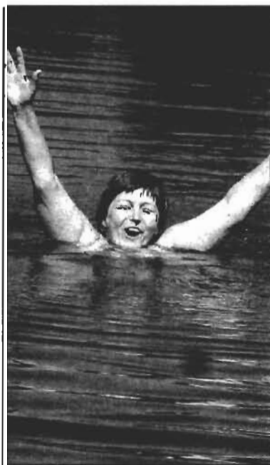
«Уголек» идут тематические занятия по безопасному купанию и поведению на водных объектах, тренинги по оказанию первой помощи на воде. Специалисты управления образования организовали просмотр диафильмов и сюжетные игры на тему безопасного поведения у воды. А городской добровольческий штаб имени Г.Е. Русанова и городской добровольческий отряд «ДоброLife» раздают в ходе акции памятки о правилах поведения.