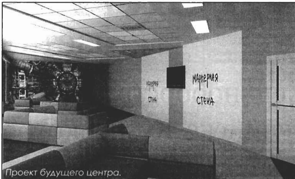
Проект будущего центра.

проекты стали реальностью: два действуют при КемГУ и КузГТУ в Кемерове, а ещё один - в Киселёвске. Причём упор делают как на точные науки (математику, физику, химию), так и на науки о земле, для чего