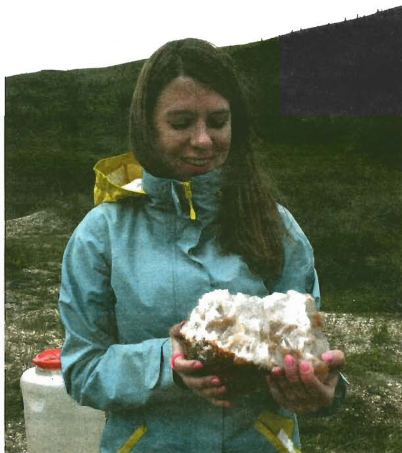
Горная роза за 600 рублей.

Перед сплавом прошли обязательный инструктаж по технике безопасности: как сидеть на рафте, как спасать выпавших за борт и самое главное - как не утопить свою честь на Катунь! «Если вы выпали за борт и утопили весло - всё! Ваша честь потеряна! Весло - это честь любого рафтера! И потом, весло стоит 1500 рублей, имейте это в виду! Можете тонуть, но весло держите до последнего!» - сказала нам инструктор с 12-летним стажем Вероника. После этого мы вытащили лодку в реку и стали рассаживаться. Состав гребцов был преимущественно женским: 12 девушек и 4 представителя сильного пола. Мне повезло сидеть на левом носу рафта - все опасности порогов и волны в 3 метра я видела в первую очередь! Пока гребли вперед, инструктор (она же капитан нашего судна) рассказывала о местных до-