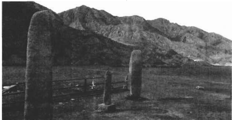
Оленные камни - памятники древности.