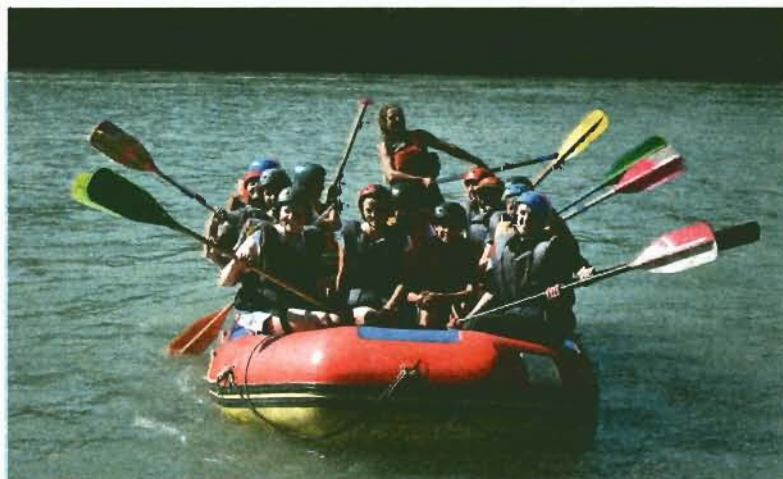
Рафт перед сплавом.