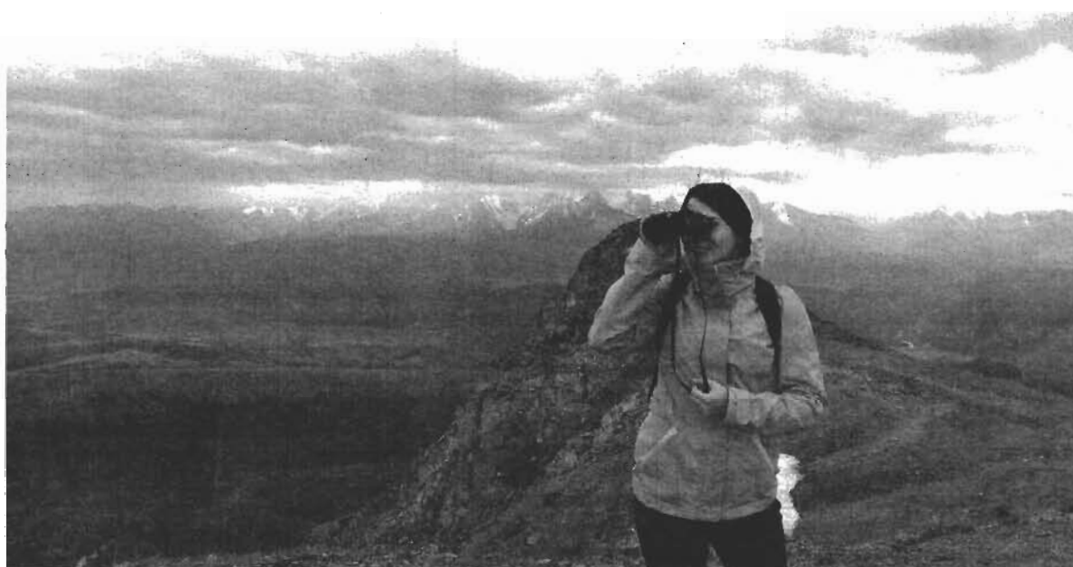
Актру. Вид на Средне-Чуйский хребет.

Первой крупной остановкой стал Семинский перевал - 583 км на дороге Р-256 (Чуйский тракт). Через это место проезжают все туристы и путешественники. Огромная памятная стела уходит ввысь, знаменуя о добровольном вхождении алтайцев в состав России в 1756 году. Высота перевала составляет 1717 м. Семинский перевал - природная граница между Северным и Центральным Алтаем. В апреле-мае здесь еще лежит снег, а вершины гор покрывают снежные шапки. Летом здесь немного прохладней, чем в остальных частях Алтая: дует горный ветер.