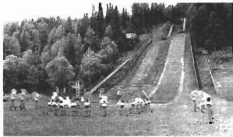
На этом трамплине можно тренироваться не только зимой, но и летом.

Врио губернатора пообещал выполнить эту просьбу. Прошло три месяца - и вот результат: трамплин К-62 на горе Югус в Междуреченске открыт после реконструкции.