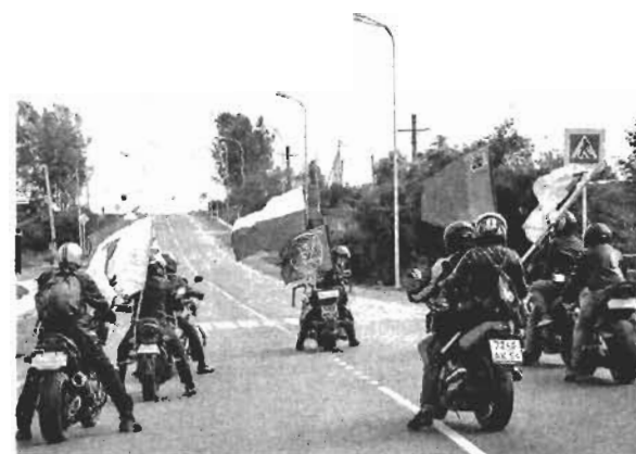
Новую дорогу первыми испытали местные байкеры.

Кстати, компания «Кузбассразрезуголь» не только строит и ремонтирует дороги, но и переустраивает водоводы, строит очистные сооружения в Бачатском, можно сказать, даёт поселку новую жизнь.