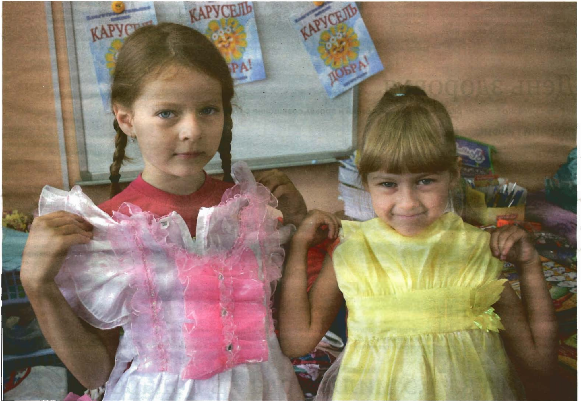
В преддверии нового учебного года в социально-реабилитационном центре для несовершеннолетних «Радуга» прошла традиционная благотворительная акция «Карусель добра».