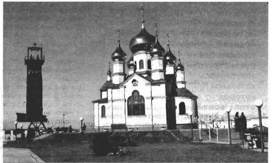
Бассейн появится недалеко от музея Шахтерской славы Кольчугинского рудника и храма С. Радонежского.

Еще одно изменение касается территории бывшего завода «Кузбассэлемент». Сейчас улица Спасстанция находится в производственной зоне, но вдоль нее, ближе к ул. Шакурина, располагаются объекты, не предусмотренные для промышленной зоны, - это магазины «Маяк», «Холди», «Кузбассэнергосбыт» и другие организации.