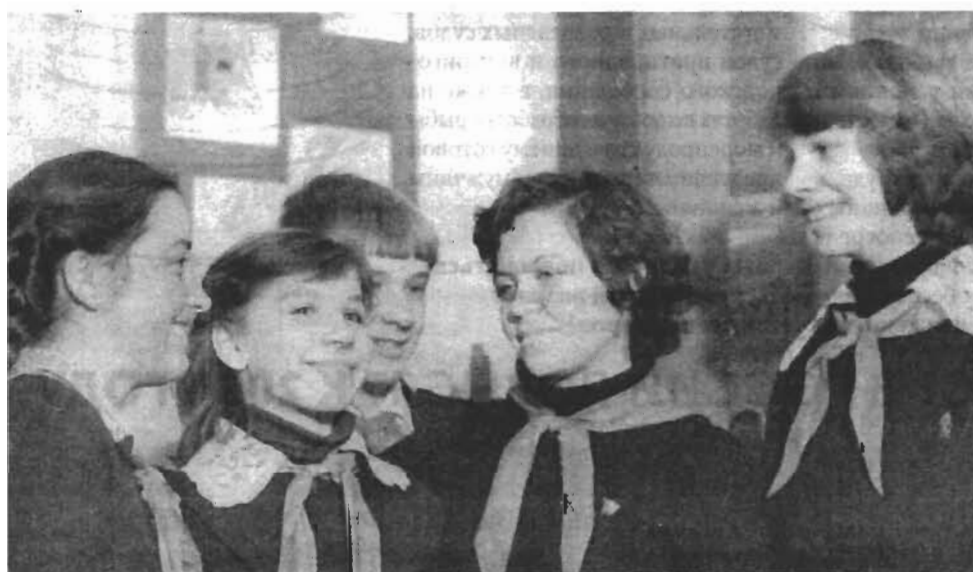
Школа № 73, 1978 год

Часто ли вам приходится отвечать на вопрос, какой период своей жизни вы считаете самым знаменательным и запоминающимся? Попробуйте сделать это. А вот я, не задумываясь, ответу на него: это работа в комсомоле!