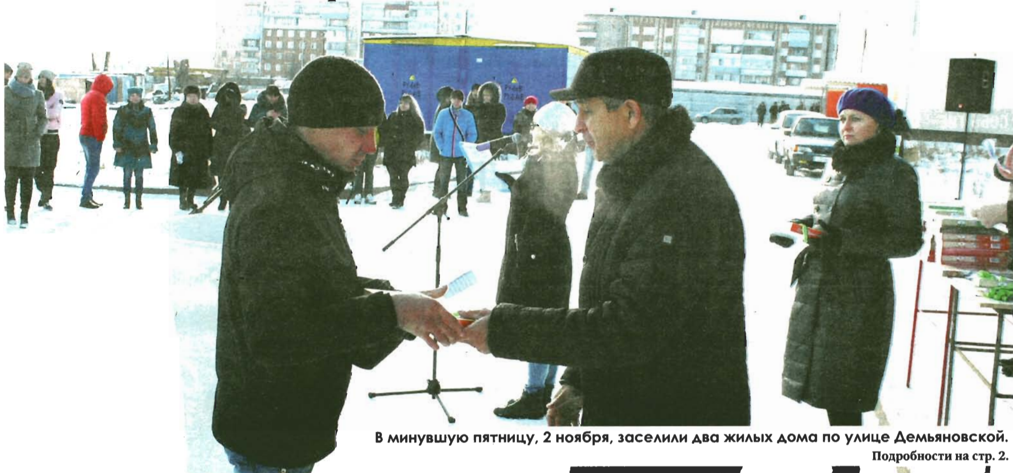
В минувшую пятницу, 2 ноября, заселили два жилых дома по улице Демьяновской. Подробности на стр. 2.