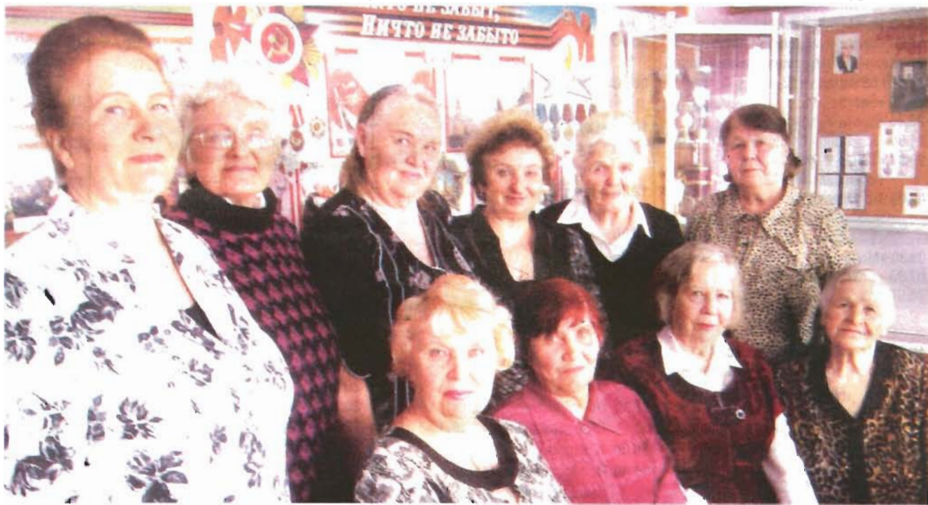
С коллективом учительского клуба «Ветеран».