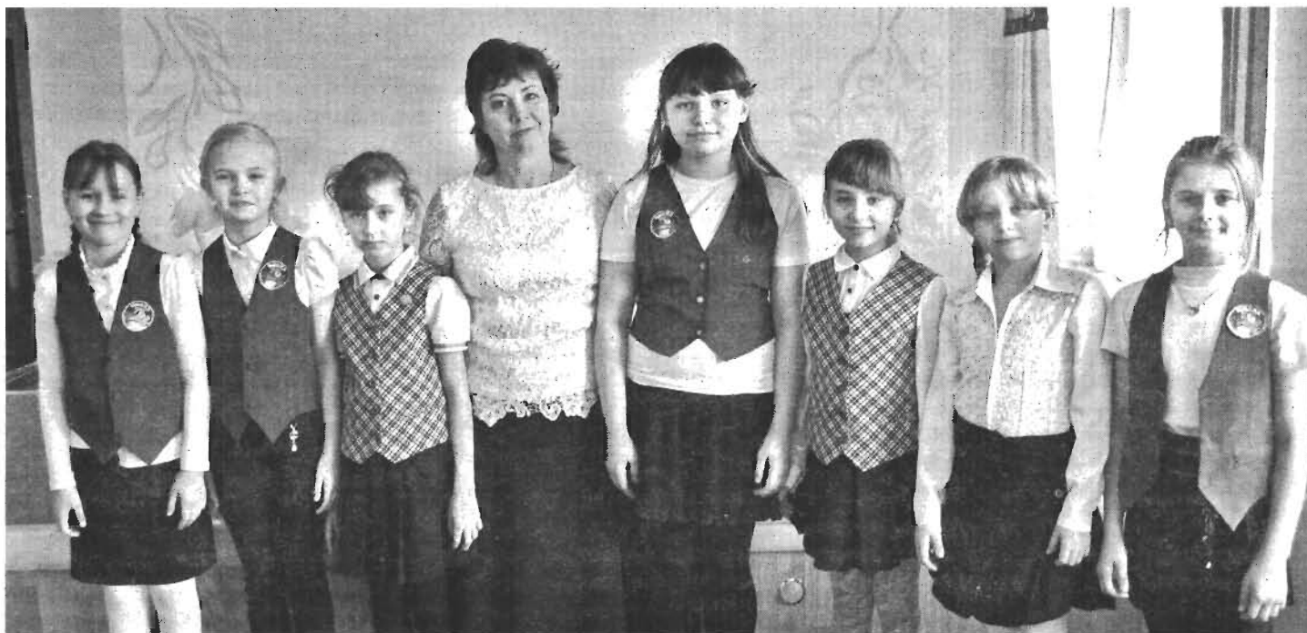
80-летний юбилей школы, 3 класс, 2015 год.