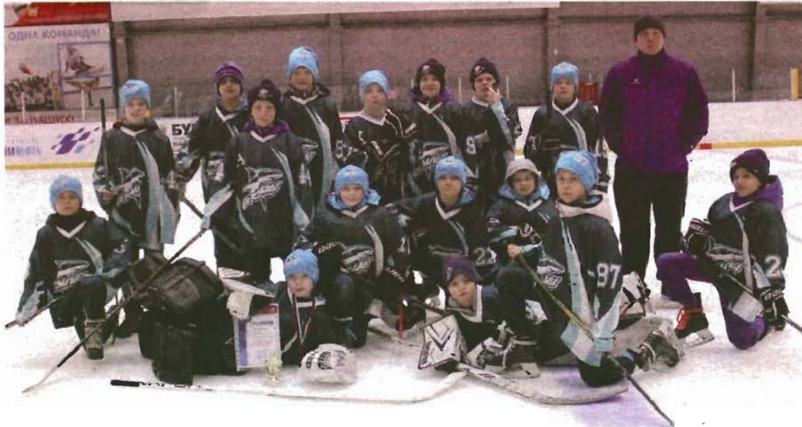
Ленинск-кузнецкая команда «Акулы».