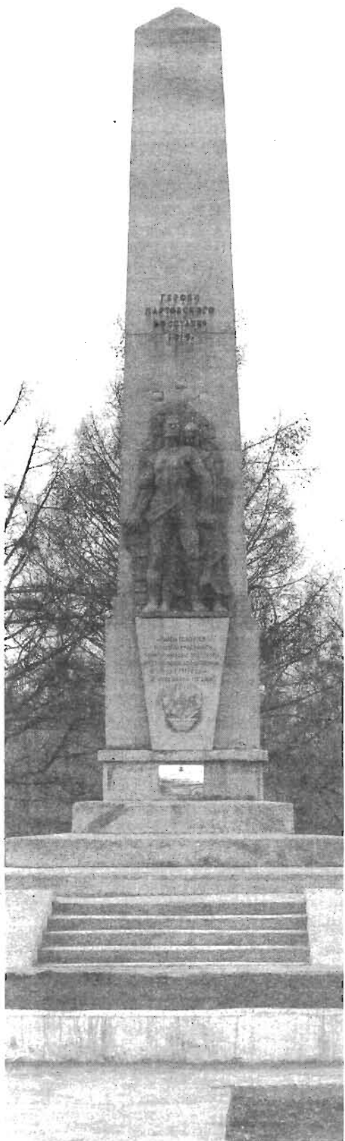
Памятник героям Мартовского восстания 1919 года.