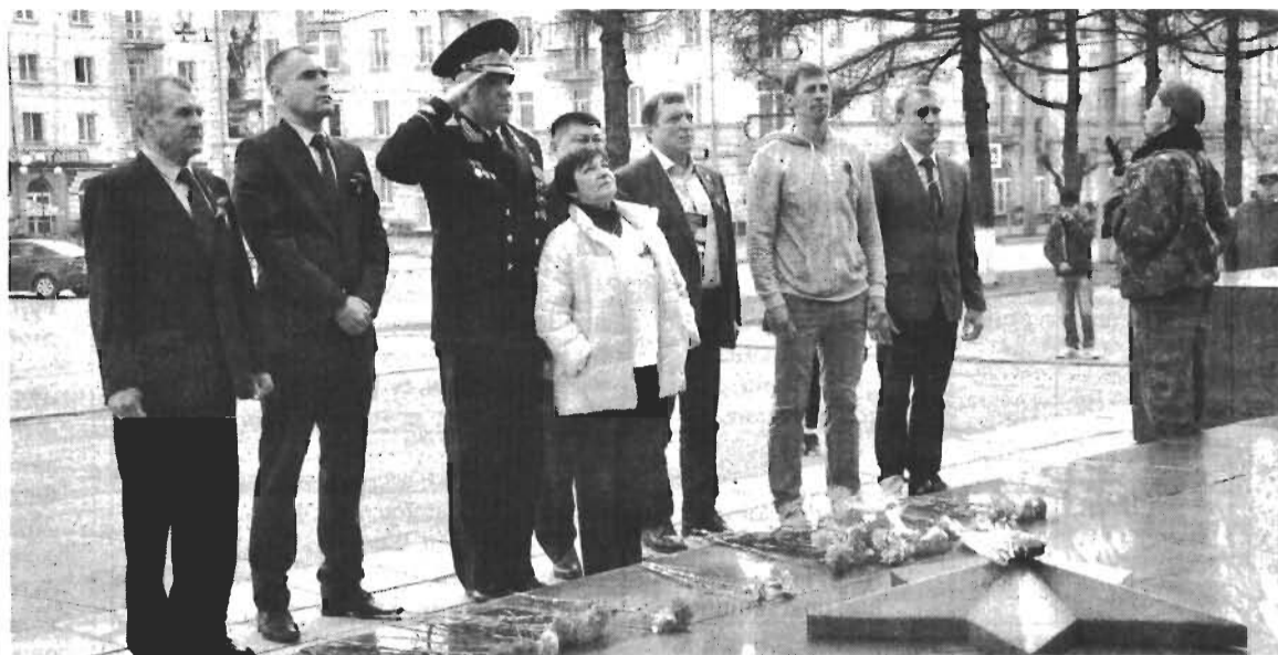
Почтили память погибших земляков.