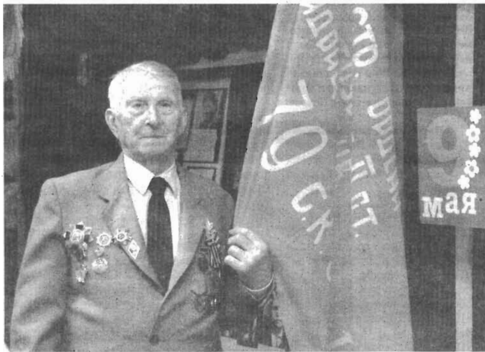
В зале городского краеведческого музея у знамени Победы.

Наш эшелон остановился по пути на станции Сталинград. Город после тяжелейших боёв лежал в руинах, его длина в ту пору составляла 16 км, а ширина - всего 3 км по правому берегу Волги. Состав стоял сорок минут, заправляясь углём и водой. Я вышел из вагона. Ту картину никогда не забыть. На месте больших домов лежали груды кирпича, от деревянных зданий остались одни печные трубы - город немцы разрушили до основания снарядами и бомбами. Много раз на фронтовом пути я видел развалины, но