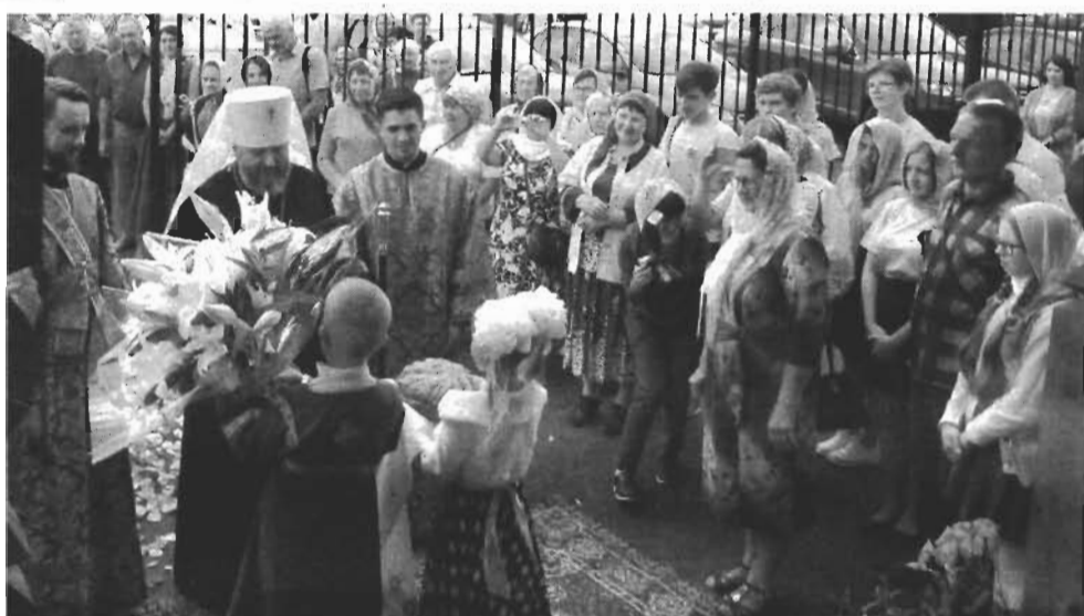
Первый приезд владыки Аристарха в храм.

Недавно образовано православное сестричество, названное в честь евангельских сестер Марфы и Марии. Сестры милосердия организуют благотворительные акции, посещают больных, помогают престарелым прихожанам. Сейчас разрабатываем экскурсионный маршрут по храму для людей с ограниченными физическими возможностями.