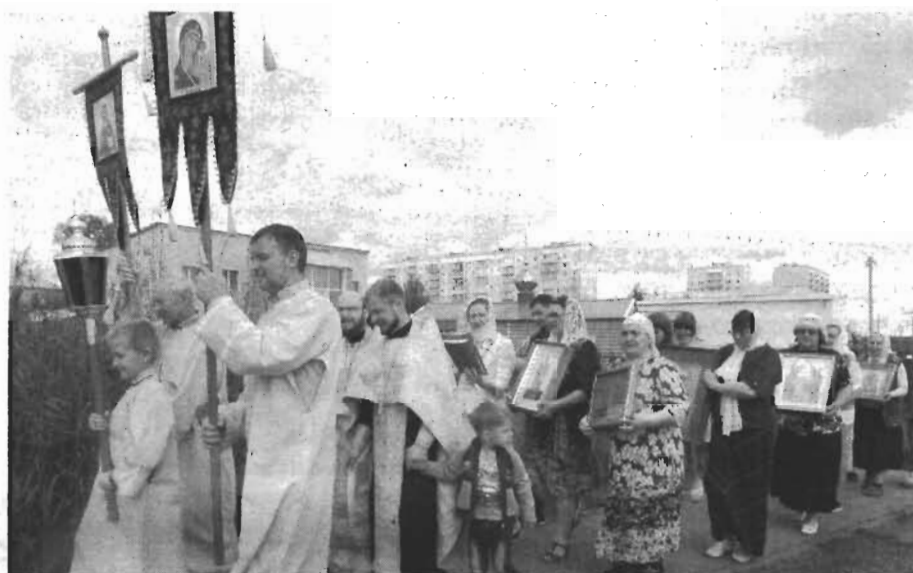
2017 год. Перенос икон в новый храм.

сотрудников и прихожан за доброе и теплое отношение к своему делу, друг к другу и к тем, кто заходит к нам впервые.