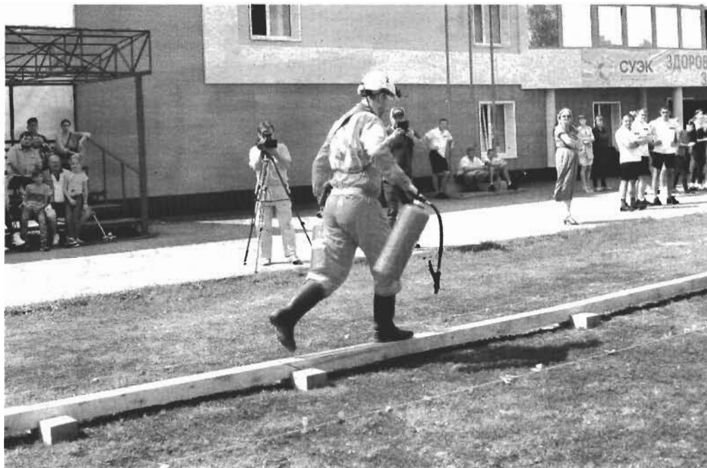
С огнетушителями на полосе препятствий.

Вспомогательную горноспасательную команду шахты «Комсомолец» все видят издали, и дело не только в ярко-оранжевых комбинезонах. За пять лет проведения отборочных соревнований здесь, в Ленинске-Кузнецком, между командами «СУЭК-Кузбасс» бойцы «Комсомолки» четырежды были признаны лучшей командой и становились участниками престижных международных соревнований в Канаде и Екатеринбурге.