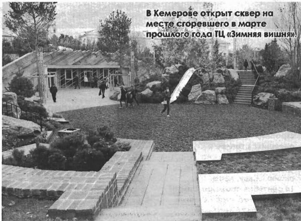
В Кемерове открыт сквер на месте сгоревшего в марте прошлого года ТЦ «Зимняя вишня».