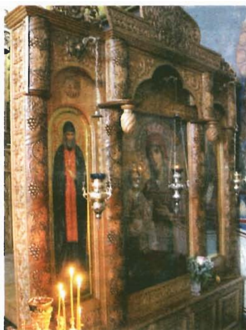
Чудотворная икона Божией Матери «Троеручица».