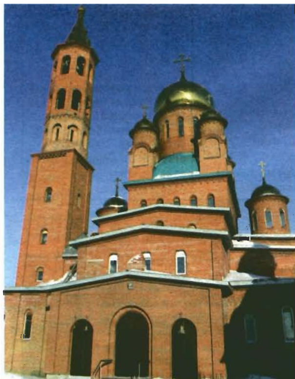
Храм Иверской иконы Божией матери. Иверский мужской монастырь (ул. Коростылева, 6).