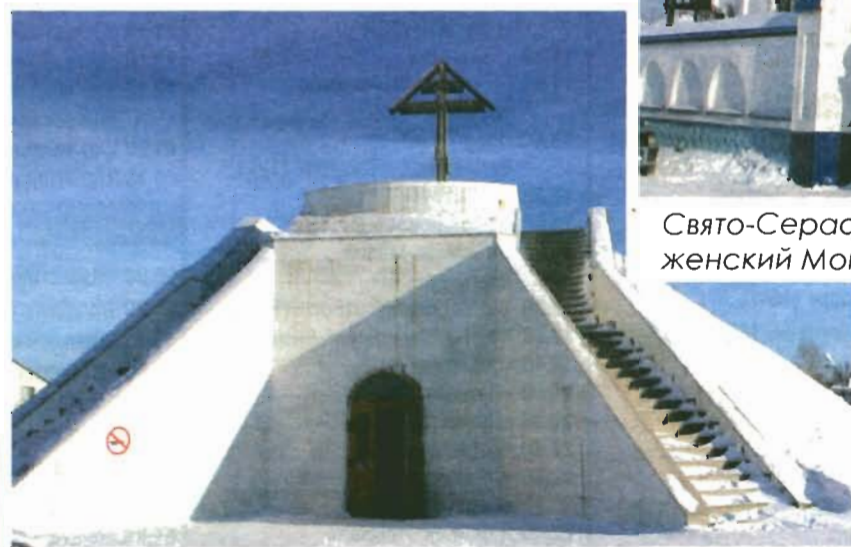
Храм Голгофа прихода Воскресения Христова. (ул. Белградская, 14).