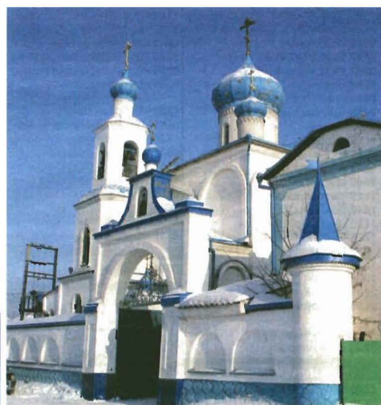
Свято-Серафимо-Покровский женский Монастырь (ул. Советская, 187.)