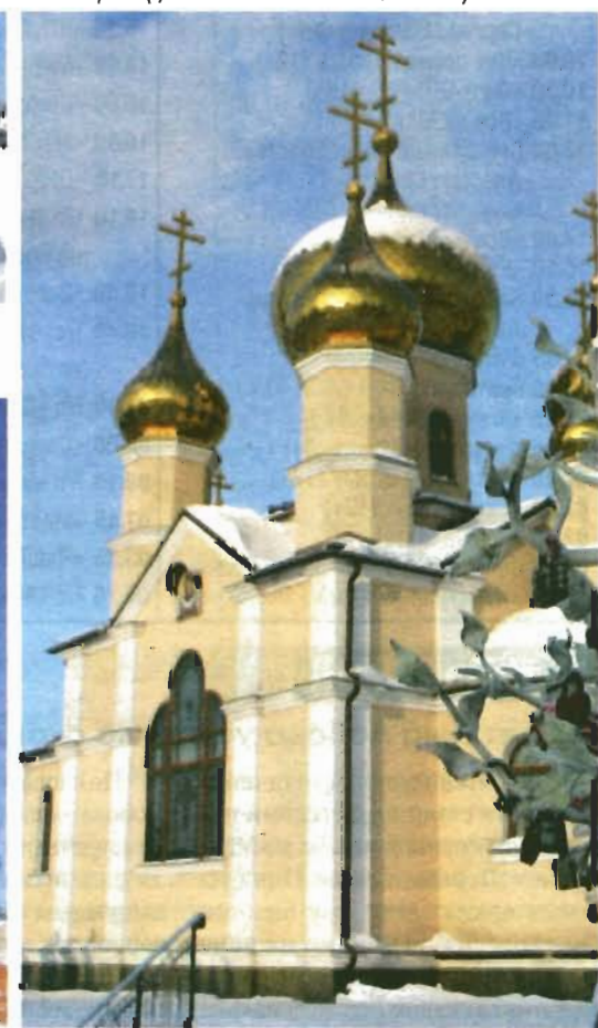
Храм в честь святого преподобного Сергия Радонежского (пр-т Кирова, 99).