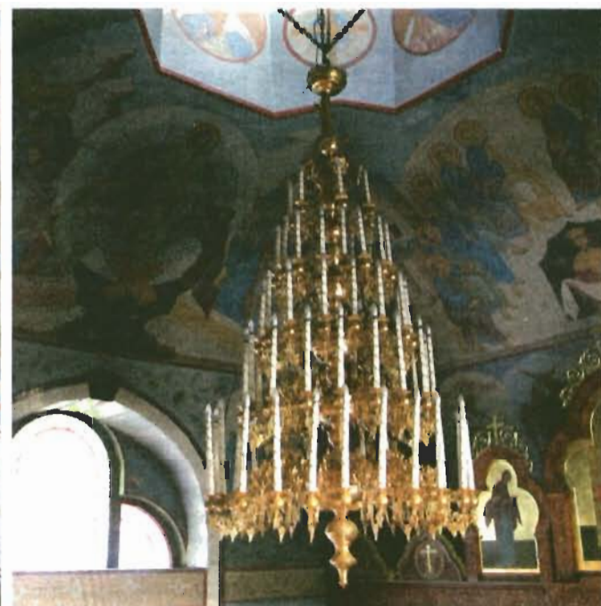
Паникадило в храме в честь Сергия Радонежского.