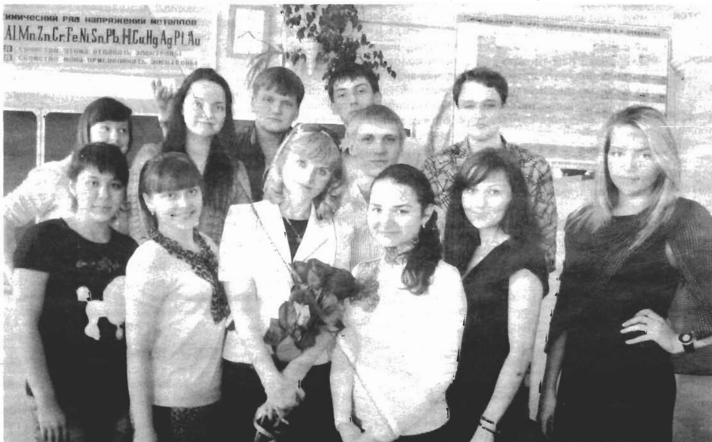
Первая группа углубленного изучения химии. 2013 год.