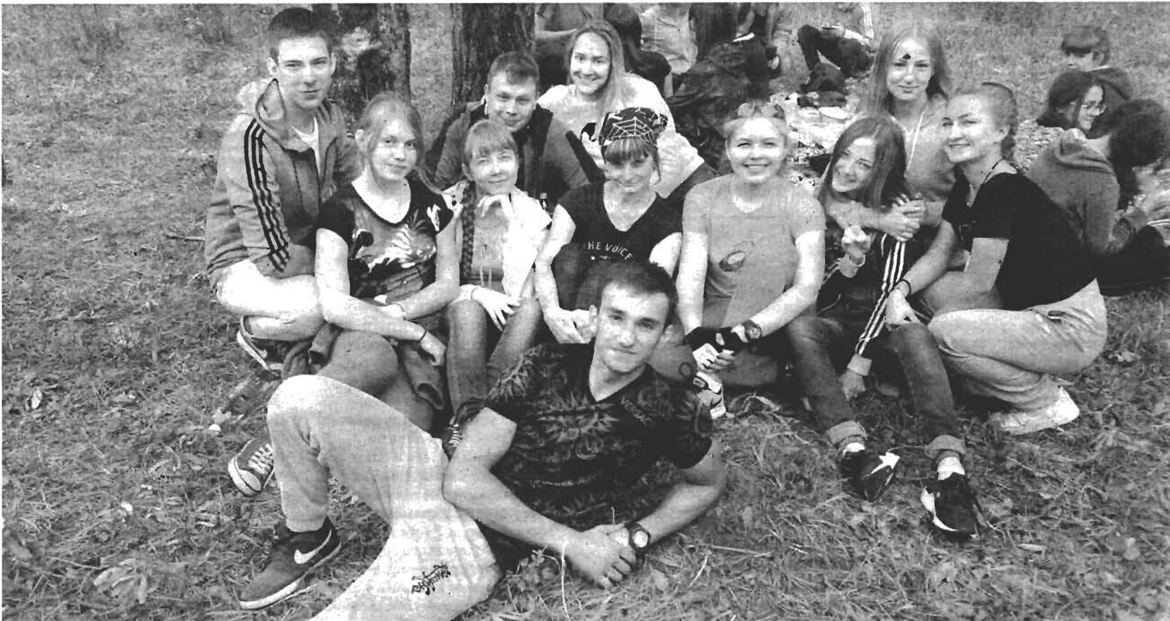
В походе со своим классом.