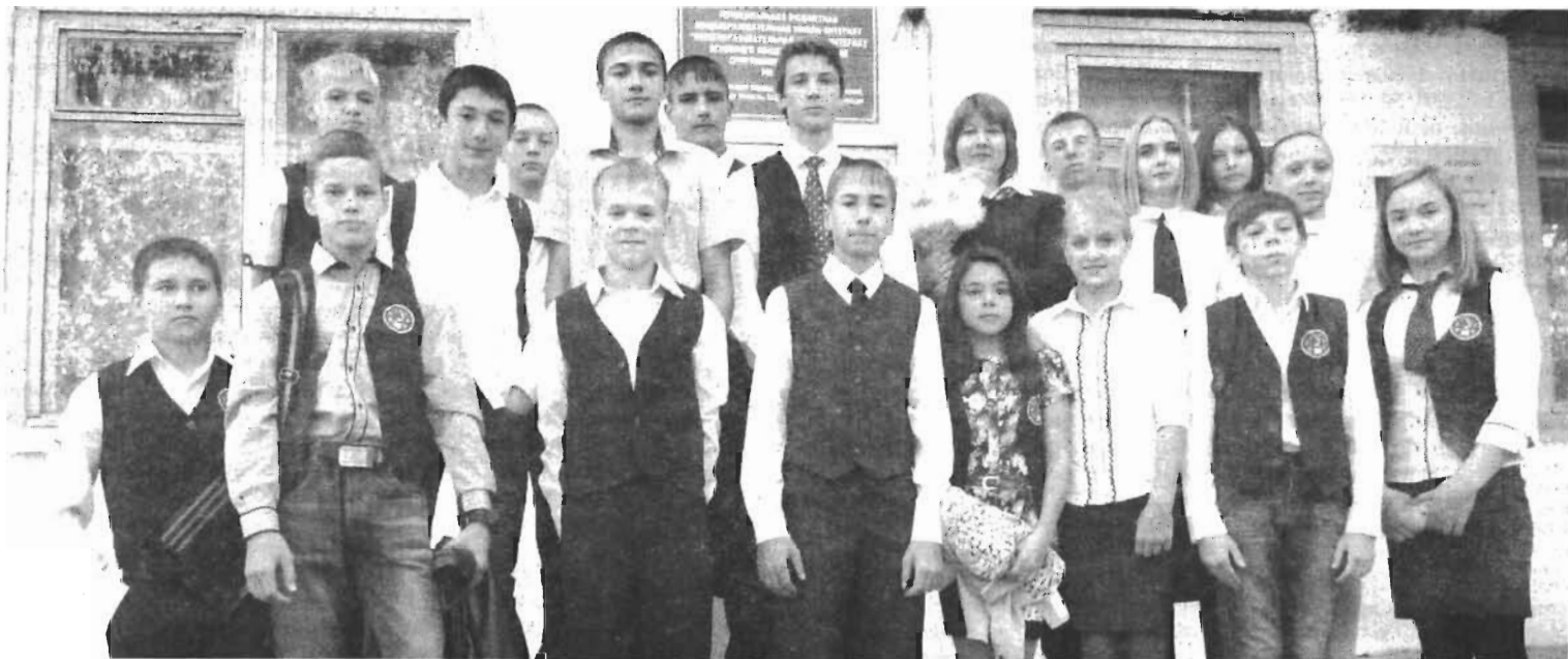
Выпуск 2016 года.

под увеличением. Говорят, очень красивые бывают экземпляры, что даже фотографируют себе на память. Конкурса красоты среди плесени пока не проводили, но бывают очень достойные экземпляры. Ведь всё это детям в диковинку. На таких уроках они чувствуют себя первооткрывателями.